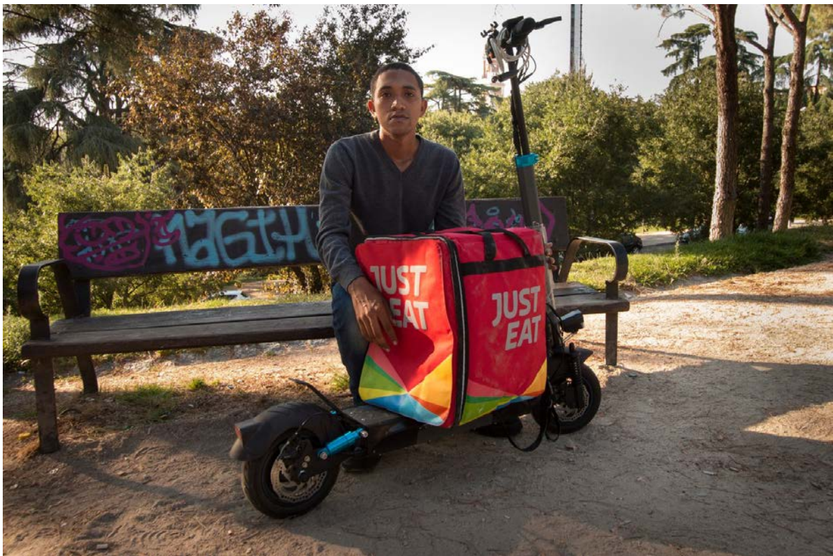
Obrázok 1 – 22-ročný venezuelský emigrant, ktorý žije v Madride

Venezuelčanov. Dnes toto číslo presahuje 410 000, čo je číslo vyššie ako v španielskej čínskej diaspóre (228 000), aj keď je to ďaleko od 776 000 občanov z Maroka, alebo 632 000 z Rumunska. Noví prichádzajúci z juhoamerickej krajiny majú však značné rozdiely so severoafrickými a európskymi migrantmi. Venezuela bola už šesť rokov krajinou pôvodu, ktorá podala najviac žiadostí o azyl v Španielsku, prvej hostiteľskej krajine v EÚ. V súlade s politickou krízou, v ktorej Národné zhromaždenie odmietlo uznať Nicolása Madura za prezidenta (a čo prispieva k hospodárskej kríze, ktorá sužuje karibskú krajinu od roku 2013), schválila španielska vláda v roku 2019 zákon, ktorý udeľuje pobyt pre humanitárnych pracovníkov Venezuelčanom, ktorí nespĺňajú podmienky na získanie azylu. S viac ako 63 000 registrovanými Venezuelčanmi je ich preferovanou destináciou Madrid, nasledovaný Barcelonou a Tenerife. V roku 2021 bolo v Španielsku registrovaných 199 078 Venezuelčanov.