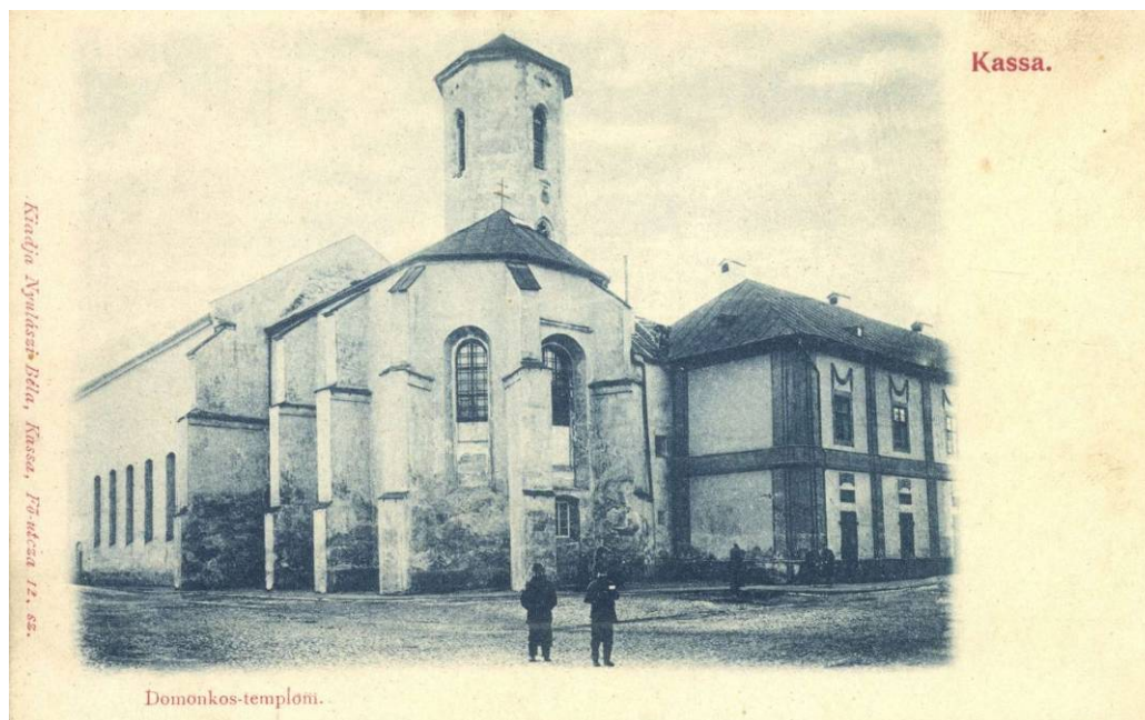
Obr. 3 – Dominikánsky kostol a kláštor v Košiciach v 40. rokoch 20. storočia