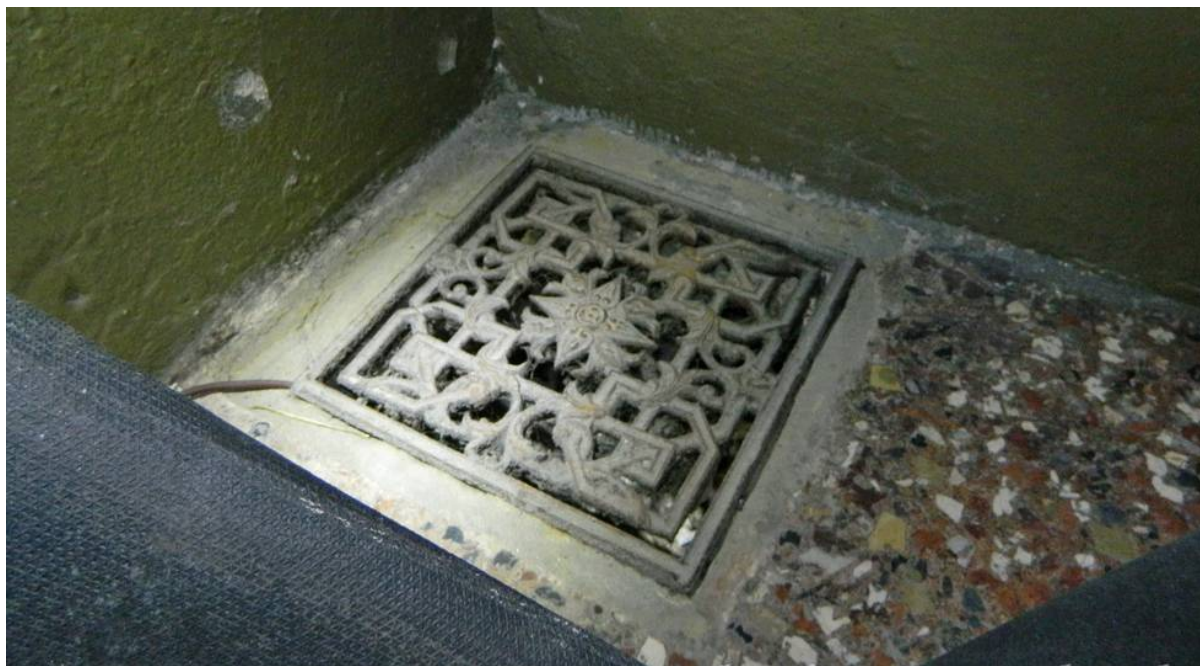
Obr. 9 – Mreža jedného zo štyroch vetrákov krypty nachádzajúcich sa v presbytériu kostola