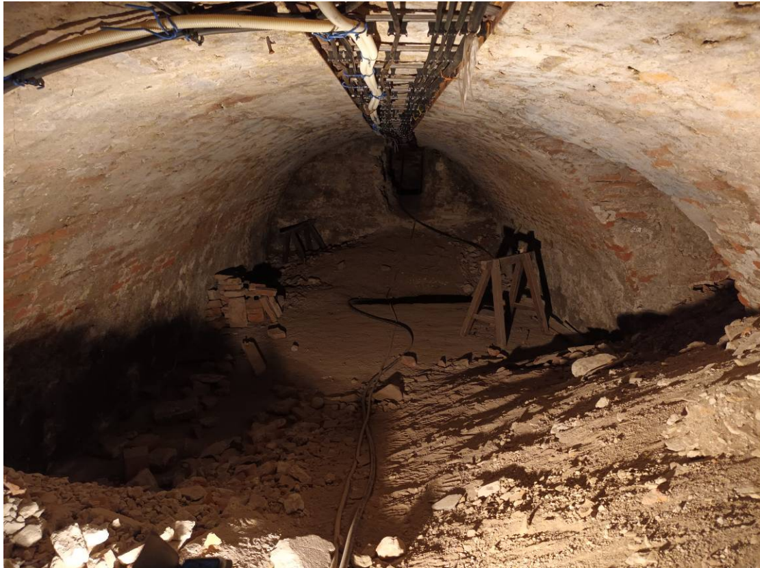
Obr. 8 – Priestor krypty, kde sa skrývali ľudia prenasledovaní nylasmi