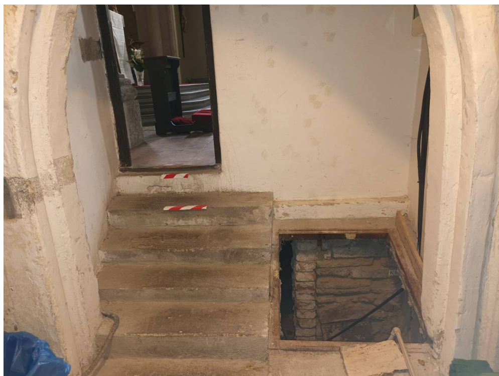
Obr. 7 – Vchod do krypty