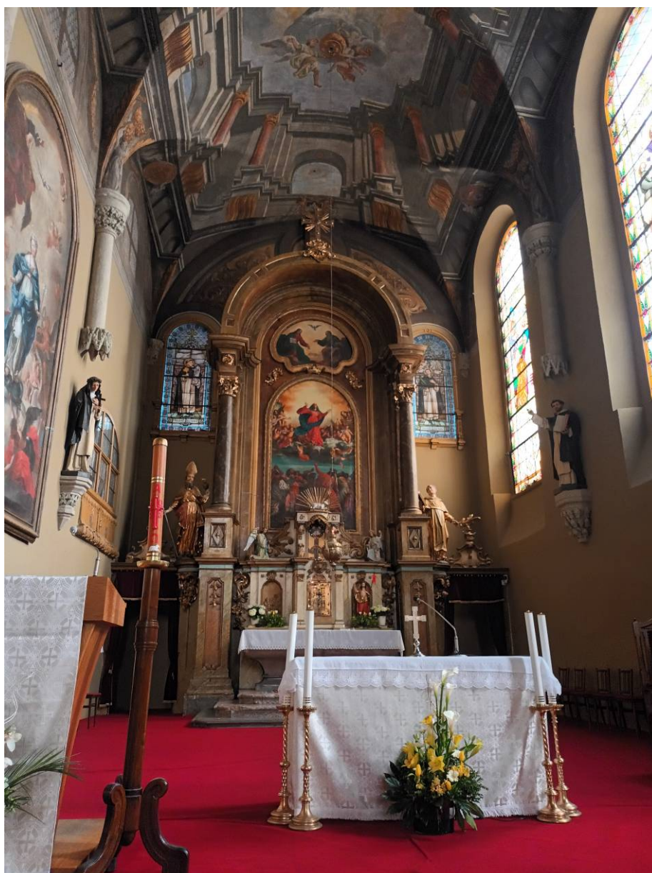
Obr. 1 – Interiér dominikánskeho Kostola Nanebovzatia Panny Márie v Košiciach v roku 2023

Kľúčové slová: dominikán, Košice, holokaust, druhá svetová vojna, záchrana