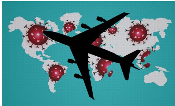
Obr. 2- Biologické hrozby a letecká doprava

Biologické hrozby ovplyvňovali svet od nepamäti. A však existujú aj možnosti cielených útokov vo forme bioterorizmu, ktorý je charakterizovaný úmyselným využitím mikroorganizmov, ktoré majú vyvolať škodlivý efekt, spôsobujúci rôzne zdravotné ťažkosti alebo smrť ľuďom, hospodárskym zvieratám alebo poľnohospodárskym plodinám. Letectvo, prostredníctvom ktorého dochádza k ľahkému šíreniu takýchto faktorov, je do značnej miery ovplyvňované ich následnými dopadmi, ktoré brzdia jeho ďalší rozvoj. (KLEMENT, C. 2020)